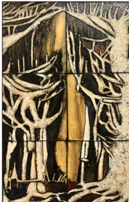
Racines de la série arbres