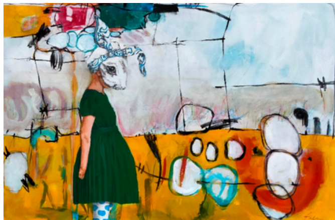
Lapin de mars