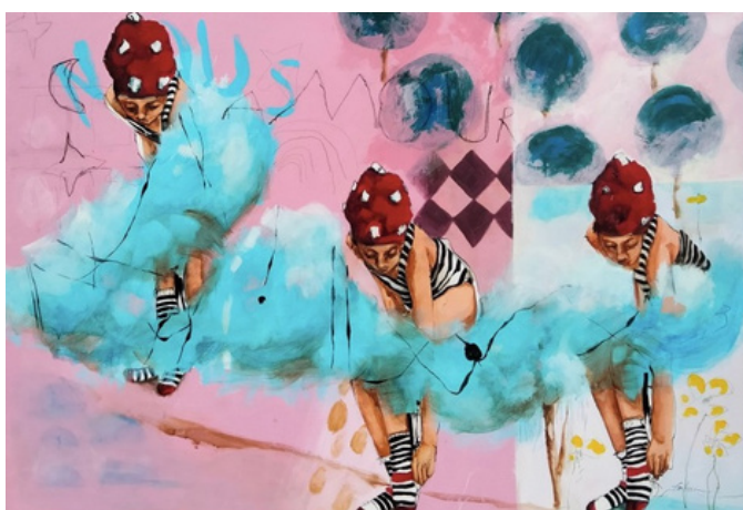
Ligne de départ