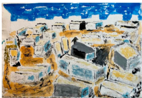
Cimetière juif à Asilah