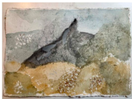
Paysage de Tanger en plein midi