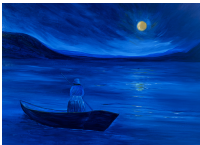
Clair de lune au lac Titicaca