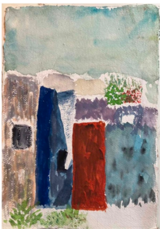
Le vieux mur à Asila