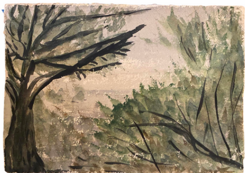
Au début du jour Tanger