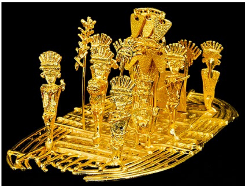
«Le Radeau Muisca», représentant la cérémonie sacrée «El Dorado», Musée de l'Or de Bogotá, Colombie

En rapport direct avec notre galerie, nous avons aussi le peuple Muisca qui constitue l'une des plus importantes communautés indigènes précolombiennes de la région de Bogotá, installée depuis le VI e siècle av. J-C. Le terme «Muisca» a pour signification «homme», «personne» ou «gens».