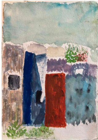
Le vieux mur à Asila