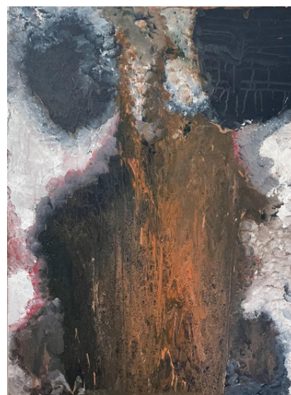
Loudest void Aenigma Acrylique sur toile 80 x 60 cm Allemagne