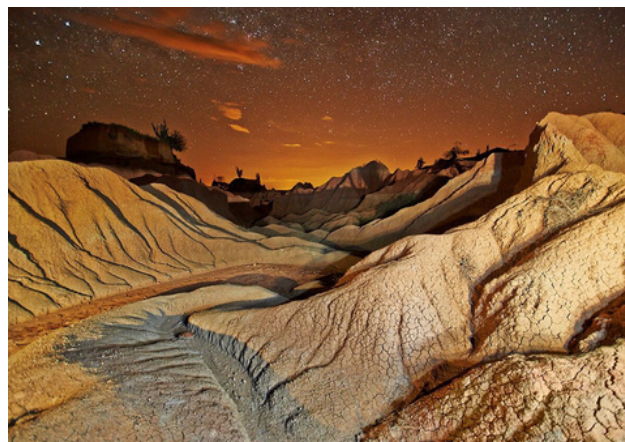
Osadía del espíritu Tulio Sampayo Impression digitale sur papier de coton 90 x 60 cm Colombie