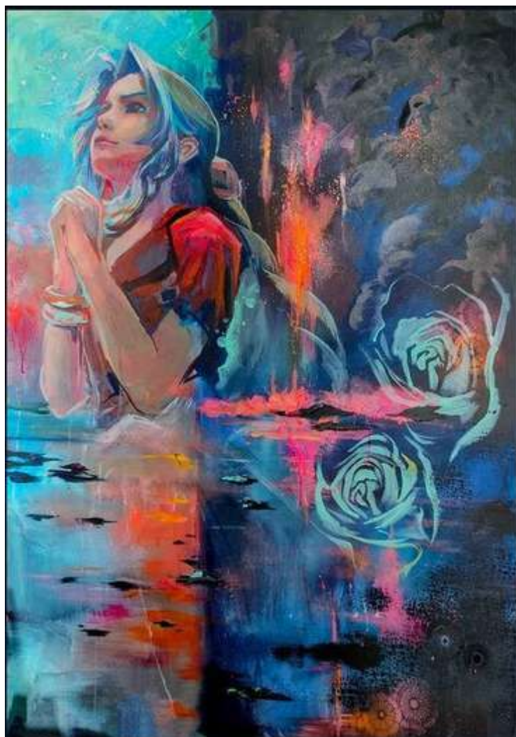
PLANET CALL ACRYLIQUE POSCA PEINTURE FLUORESCENTE 130 X 97 CM