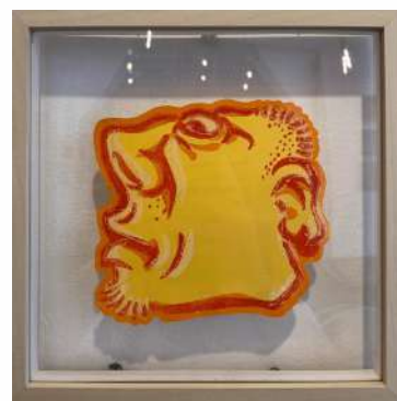
NO 9 - JAUNE LINO CUT 3 TEINTES SUR PAPIER 23 X 23 CM 650€