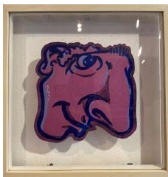
NO 30 - FUSHIA LINO CUT 3 TEINTES SUR PAPIER 23 X 23 CM 650€