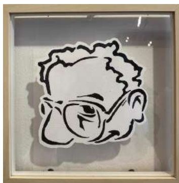
NO 29 - BLANC LINO CUT 3 TEINTES SUR PAPIER 23 X 23 CM 650€