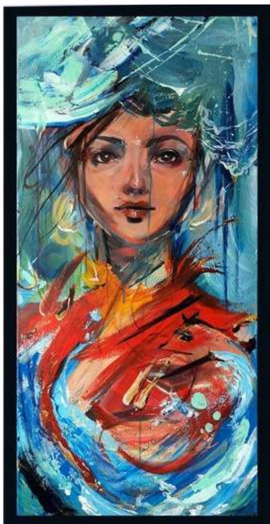
APRÈS LA PLUIE, VIENT LE BEAU TEMPS ACRYLIQUE, POSCA SUR TOILE 120 X 80 CM