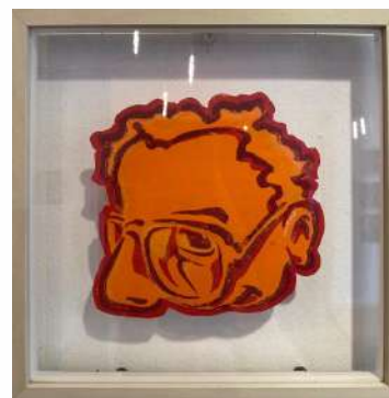
NO 29 - ORANGE LINO CUT 3 TEINTES SUR PAPIER 23 X 23 CM 650€