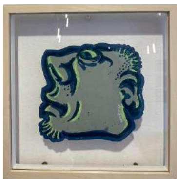
NO 9 - CYAN LINO CUT 3 TEINTES SUR PAPIER 23 X 23 CM 650€