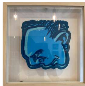
NO 1 - BLEU LINO CUT 3 TEINTES SUR PAPIER 23 X 23 CM 650€