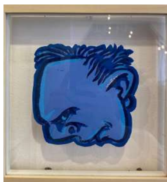
NO 1 - BLEUE (EA) LINO CUT 3 TEINTES SUR PAPIER 23 X 23 CM 650€