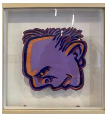
NO 1 - LILA LINO CUT 3 TEINTES SUR PAPIER 23 X 23 CM 650€