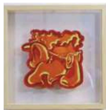
NO 11 - ORANGE LINO CUT 3 TEINTES SUR PAPIER 23 X 23 CM 650€