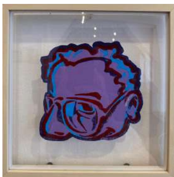
NO 29 - LILA LINO CUT 3 TEINTES SUR PAPIER 23 X 23 CM 650€