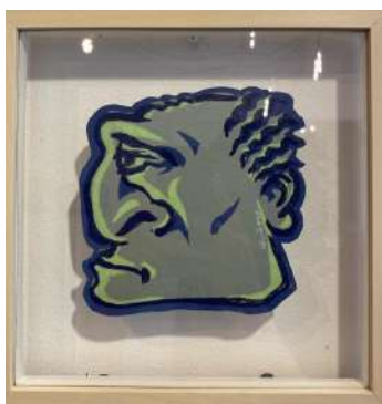
NO 21 - VERT DE GRIS LINO CUT 3 TEINTES SUR PAPIER 23 X 23 CM 650€