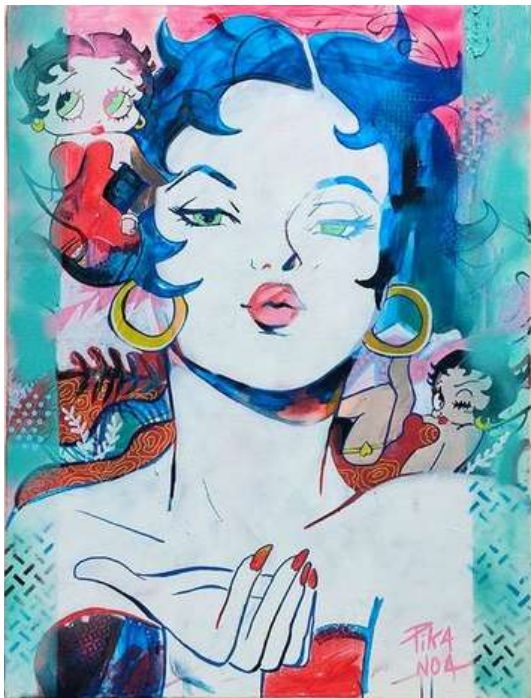
BOOP ACRYLIQUE POSCA SUR TOILE 60 X 40 CM