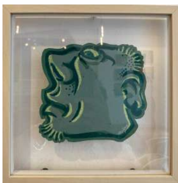
NO 9 - VERT DE GRIS LINO CUT 3 TEINTES SUR PAPIER 23 X 23 CM 650€